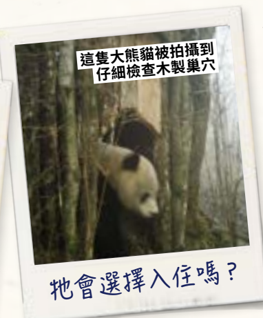
這隻大熊貓被拍攝到仔細檢查木製巢穴