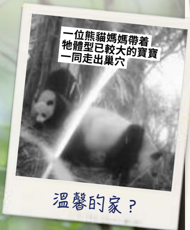
一位熊貓媽媽帶着牠體型已較大的寶寶一同走出巢穴