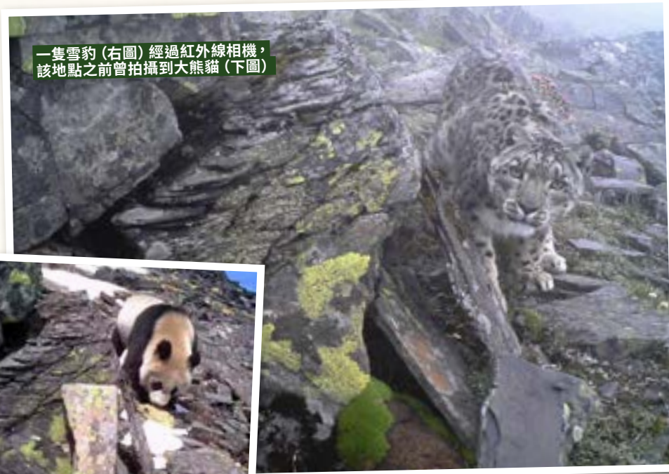
一隻雪豹（右圖）經過紅外線相機，該地點之前曾拍攝到大熊貓（下圖）