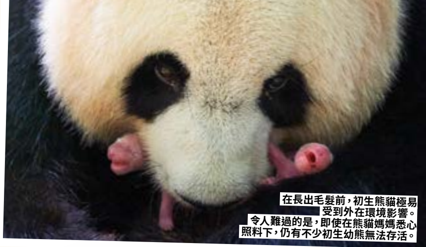
在長出毛髮前，初生熊貓極易受到外在環境影響。令人難過的是，即使在熊貓媽媽悉心照料下，仍有不少初生幼熊無法存活。

十分脆弱，需要母親全天候照顧。因此，巢穴必須設置在接近水源和竹林的地方，讓熊貓媽媽在覓食時，毋須長時間離開牠們細小、尚未長毛的孩子。我們與當地夥伴合作，已在中國大熊貓國家公園內的都江堰自然保護區，設置了20個這類人工巢穴。