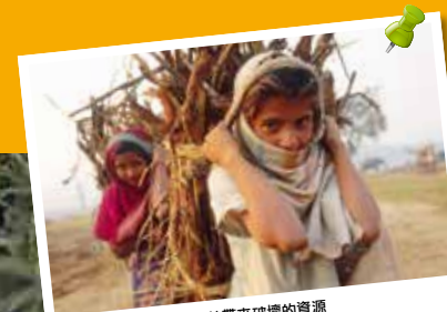
收集柴薪或其他會對森林帶來破壞的資源